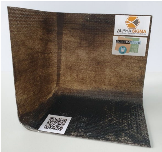
Abbildung 1: Demonstrator „Kofferecke“ entwickelt in Zusammenarbeit mit Alpha Sigma GmbH

Bereits während der Projektlaufzeit erfolgte die Herstellung eines ersten Demonstrators („Kofferecke“, Abbildung 1) im Harzinfusionsverfahren auf Basis von Basaltfaservliesstoffen bei der Fa. Alpha Sigma GmbH, Zwickau. Weiterhin konnte ein Werkzeug der Fa. Alpha Sigma GmbH, Zwickau, welches ein Teilstück einer C-Säule abbildet, für Demonstratorzwecke verwendet werden. Im Vakuuminfusionsverfahren entstanden unterschiedliche Demonstratoren auf Basis der entwickelten Verstärkungsstrukturen, wobei vor allem die Vliesstoffe aufgrund ihrer guten Drapierbarkeit überzeugten. Die Drapierbarkeit verhinderte Falten an den Krümmungen des Werkzeuges und ermöglichte so eine gute Oberflächenqualität (siehe Abbildung 2).