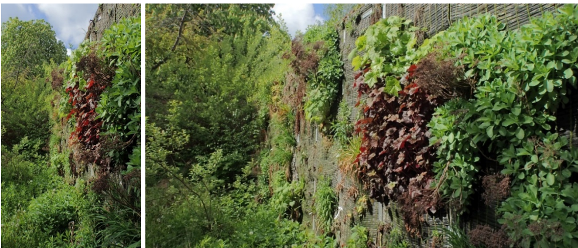
Fig. 3: textile-based façade greening (Mai 2019)

The two study sites for field tests located in Hochschule Geisenheim und Wirth & Co. GmbH in Chemnitz allowed the assessment of the plant development on textile-based plant carrier by different climatic conditions. For the experimental site Chemnitz (fig. 3) Epimedium perralchicum , Lysimachia nummularia , Waldsteinia ternata , Alchemilla erythropoda und Luzula sylvatica have proved a failure. Absolut appropriate were Heuchera-Hybride , Sedum telephium , Hemerocallis hybrida and with limits Tradescantia × andersoniana , Geum coccineum und Tellima grandiflora can be recommended for the extreme site vertical greening and especially for the tested textile plant carrier system.