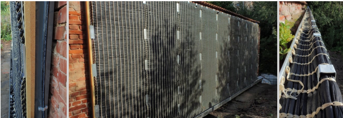
Fig. 2: multi-layered construction of the curtain wall system with insulation layer and textile plant carrier, placed on top in a frost damage save irrigation channel

The watering was realised by a capillary channel system to save an appropriate water supply even while frost changing phases. The capillary transport capacity was determined between 0.4 and 0.5 L/h and wick or 5.6 to 7.1 L/h per mattress (width 1 m).