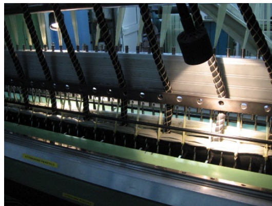
Fig. 1: Feeding of aggregated strips of spun lace into the needle lanes

By the current state of the art besides the coarse warp knitting technology there is no technology available which allows to manufacture coarse textile structures with a high three-dimensional enlargement of more than 25 mm and fulfilling the requirements to load-bearing capacity, water storage and water-holding capacity of a vegetation system. Using a coarse warp knitting machine extreme yarns, strip of spun lace and/or consolidated trimming strips of spun lace production were processed to textile plant carriers with mass per unit area between 2,072 and 3,300 g/m 2 . The water storing capacity reached up to 20 L/m 2 , for practical use a variant of 14 L/m 2 was chosen. Further functionalisation like embedding of load-bearing elements of elements for additional loads as well as the introduction of wicks (fig. 1) for a capillary water transport were successfully realised. By creating a sandwich construction made of two warp knitted PET-mattresses with inserted non-woven fabric (PET/VC) for water distribution and transport a thickness of more than 50 mm could be reached.