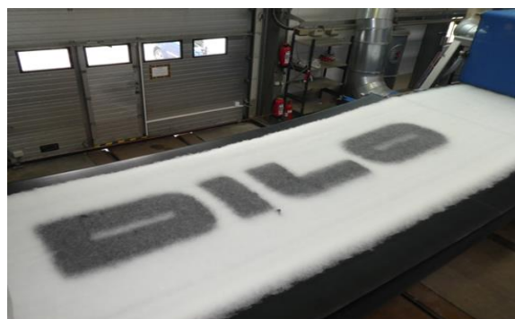
Schriftzug mit partiell zusätzlichem Fasermaterial, Quelle: Oskar Dilo Maschinenbau KG

Neben Dilo und VW sind weiterhin die Technische Universität Chemnitz, das Sächsische Textilforschungsinstitut e.V. (STFI) und die SachsenLeinen GmbH beteiligt.