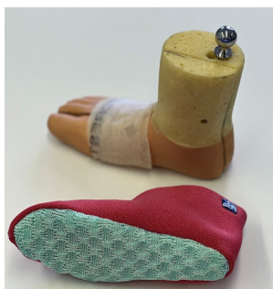
Auxetische Struktur (grün) als Grundlage für die Sohle