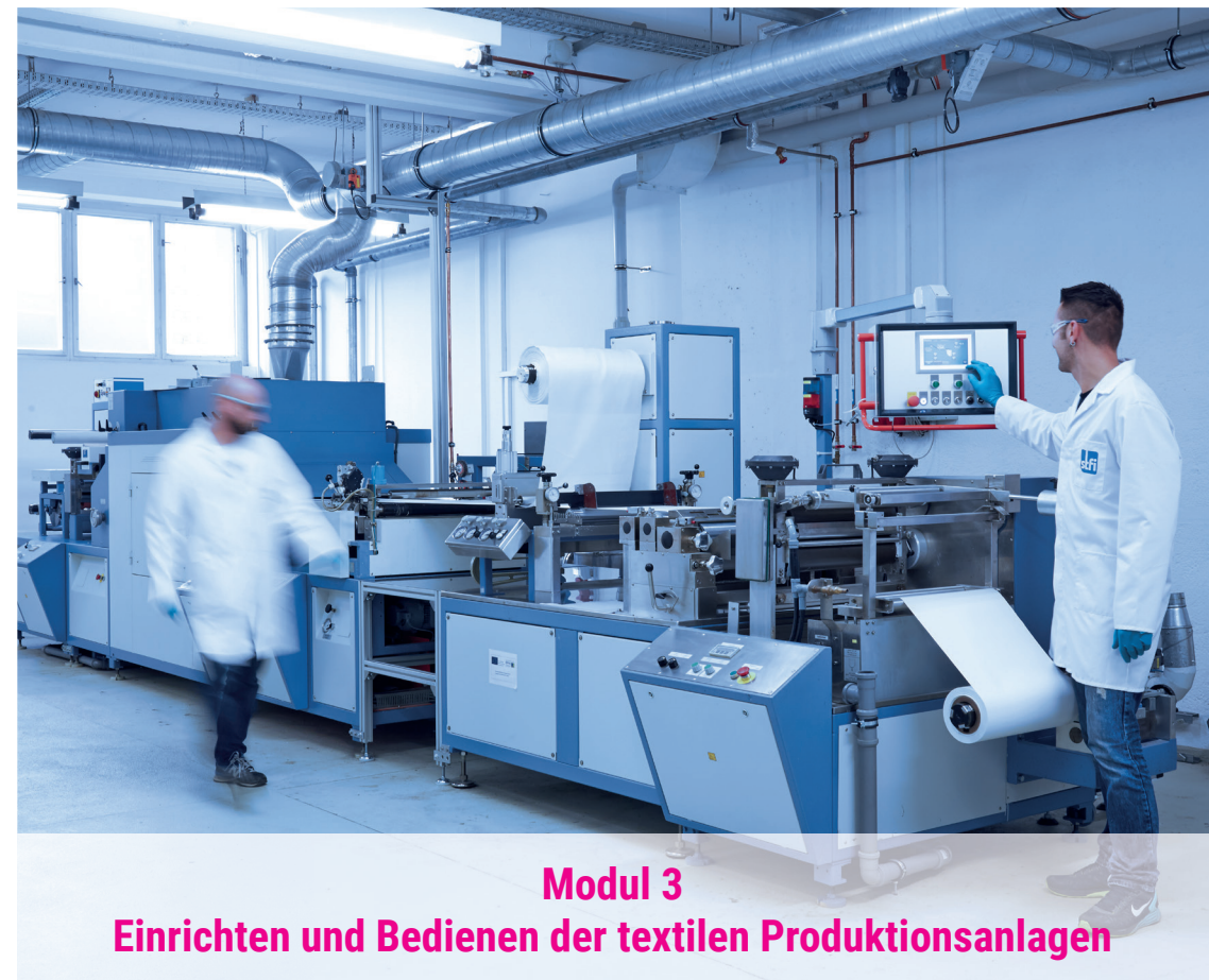
Modul 3 Einrichten und Bedienen der textilen Produktionsanlagen

Sächsisches Textilforschungsinstitut e.V. (STFI) An-Institut der Technischen Universität Chemnitz Annaberger Straße 240 | 09125 Chemnitz E-Mail: stfi@stfi.de | Website: www.stfi.de