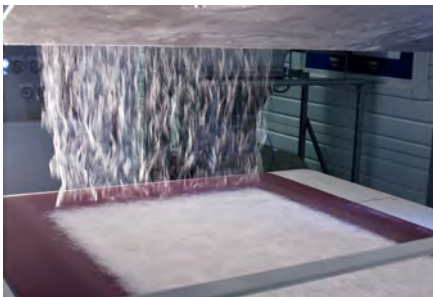
Erstellung einer Meltblown-Schicht am STFI

Die Projektergebnisse zeigen eine Machbarkeit der Feuchtigkeitsanzeige mittels hydrochromatischer Farbe. Diese wurde in einem nachgelagerten Druckprozess auf die covernde Spinnvlieslage der filternden Meltblown-Schicht aufgebracht. Durch Farbumschlag der hydrochromatischen Farbe von weiß zu transparent bei steigender Feuchtigkeitsaufnahme konnte eine stromlose Feuchtigkeitsanzeige erzeugt werden. Untersuchungen zeigten eine gute Haftfestigkeit der Farbe auf dem Material.